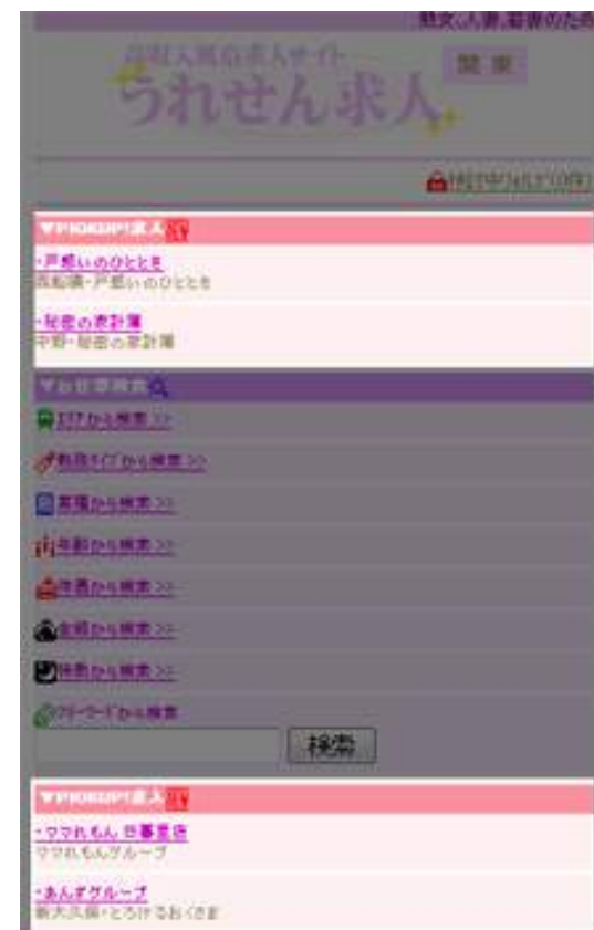
モバイル版 テキスト表示

PC版・スマホ版・モバイル版のTOPの上下2枠ずつランダムに表示します。 グループ店バナー掲載可、リンク先はうれせん求人店舗詳細ページです（外部リンク不可）